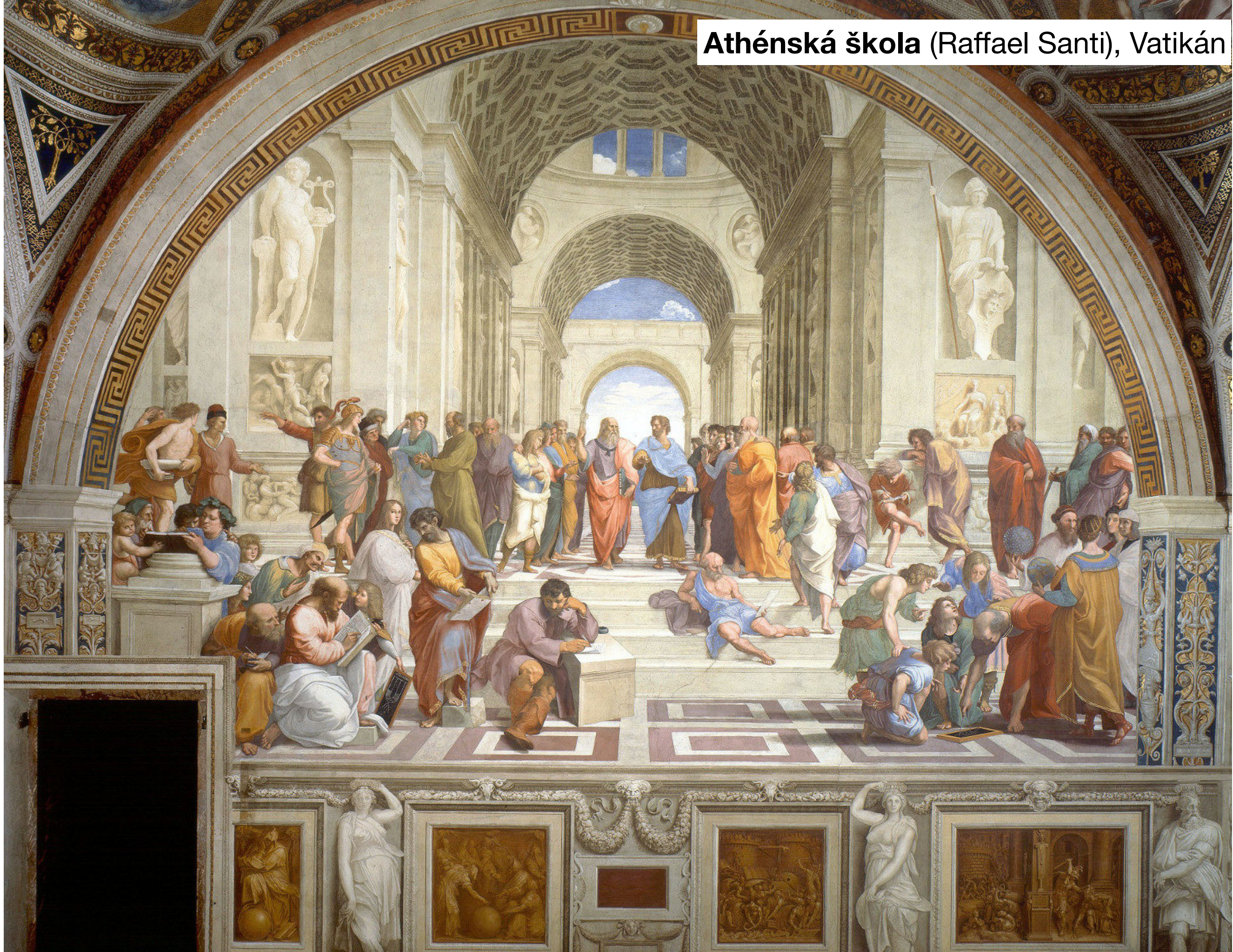
Athénská škola (Raffael Santi), Vatikán