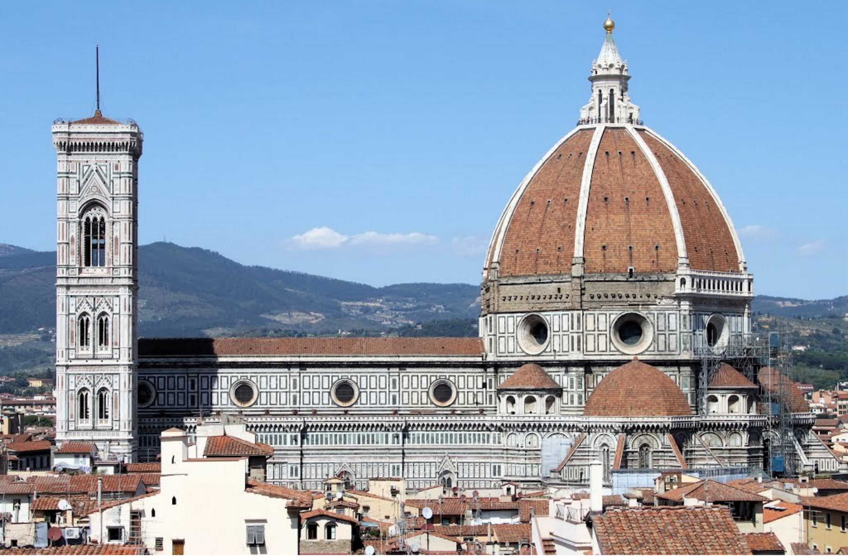
Dóm ve Florencii (Filippo Brunelleschi) - kopule je jednou z prvních renesančních staveb