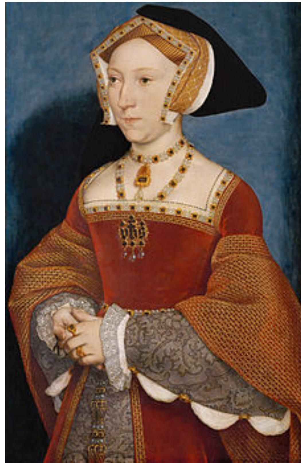
portrét Jane Seymour, 3.manželky Jindřicha VIII.