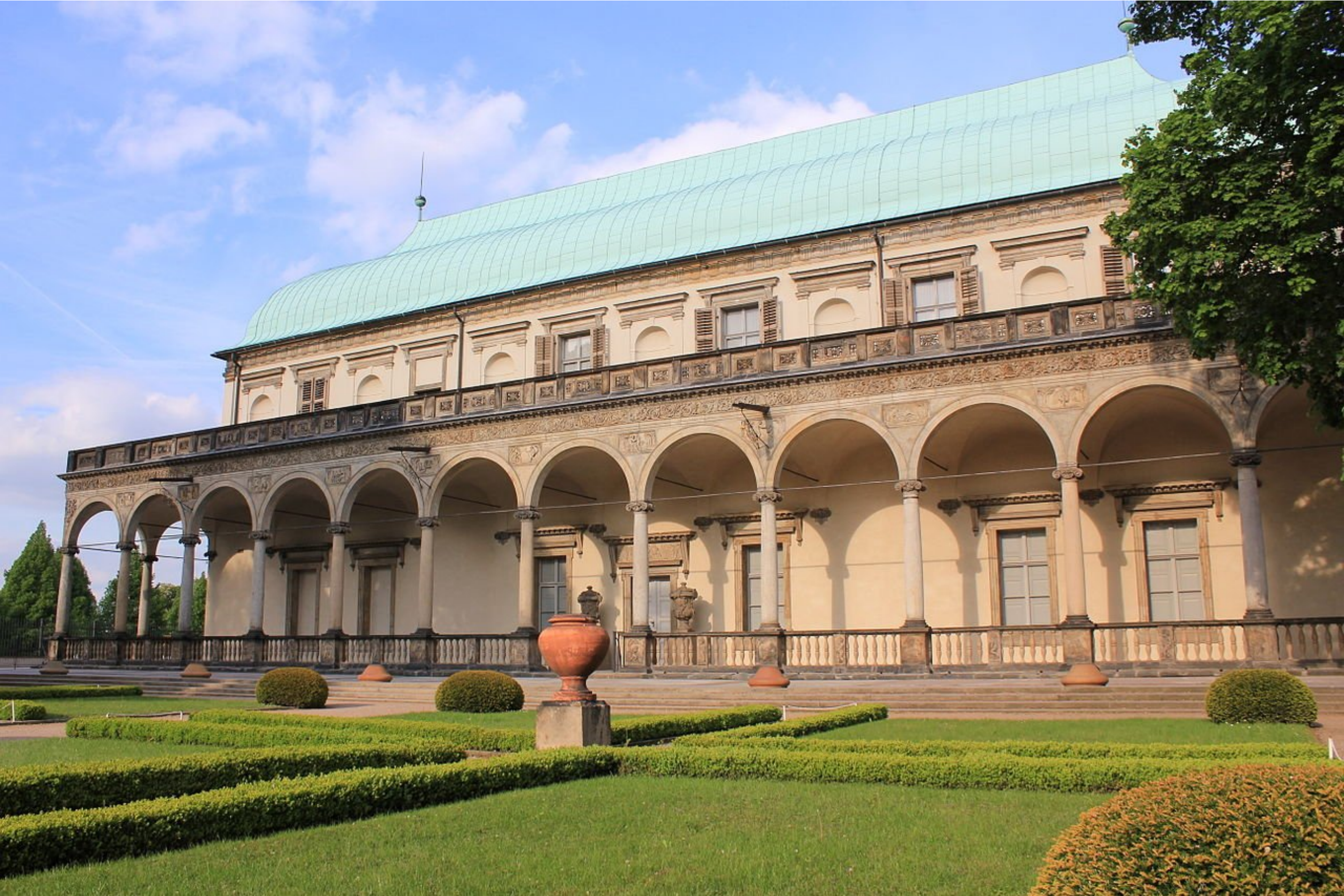
letohrádek královny Anny (Belveder) na Pražském hradě