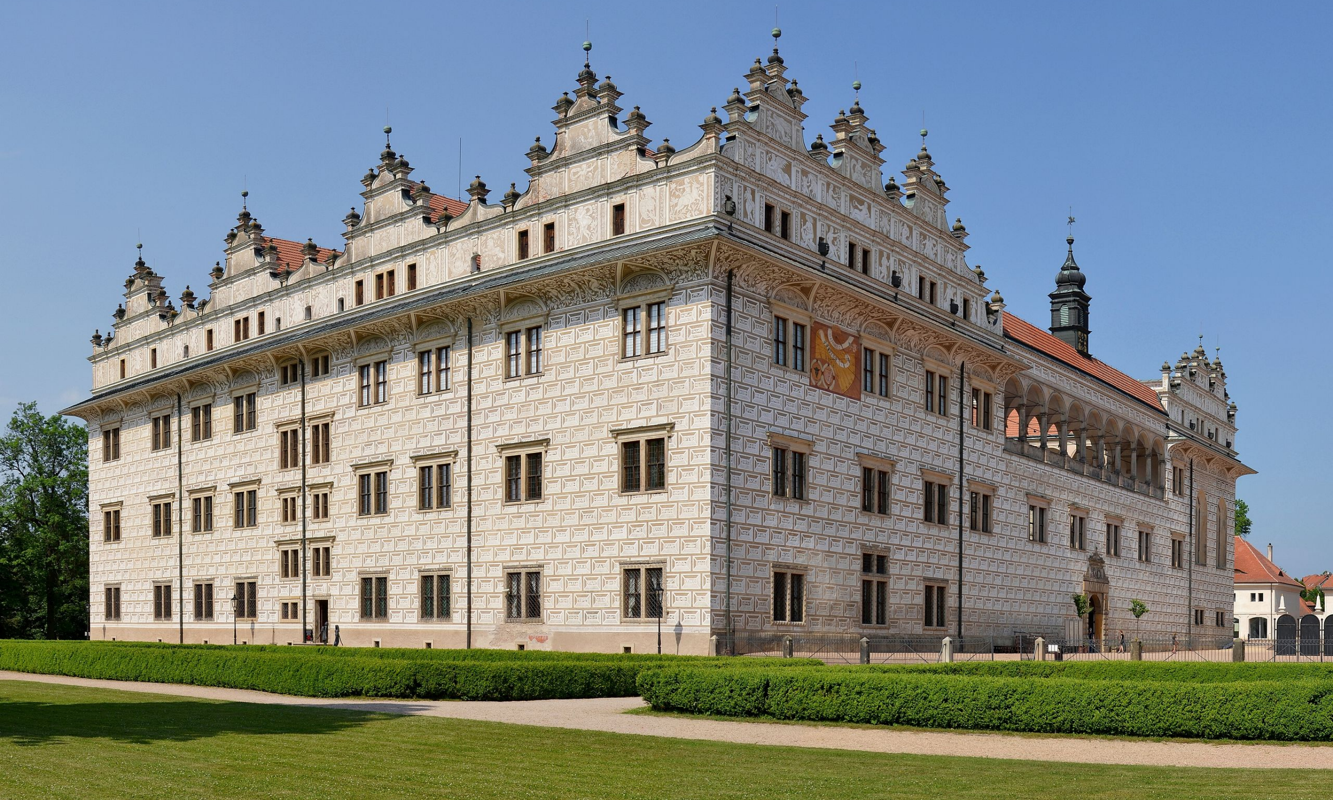
zámek v Litomyšli