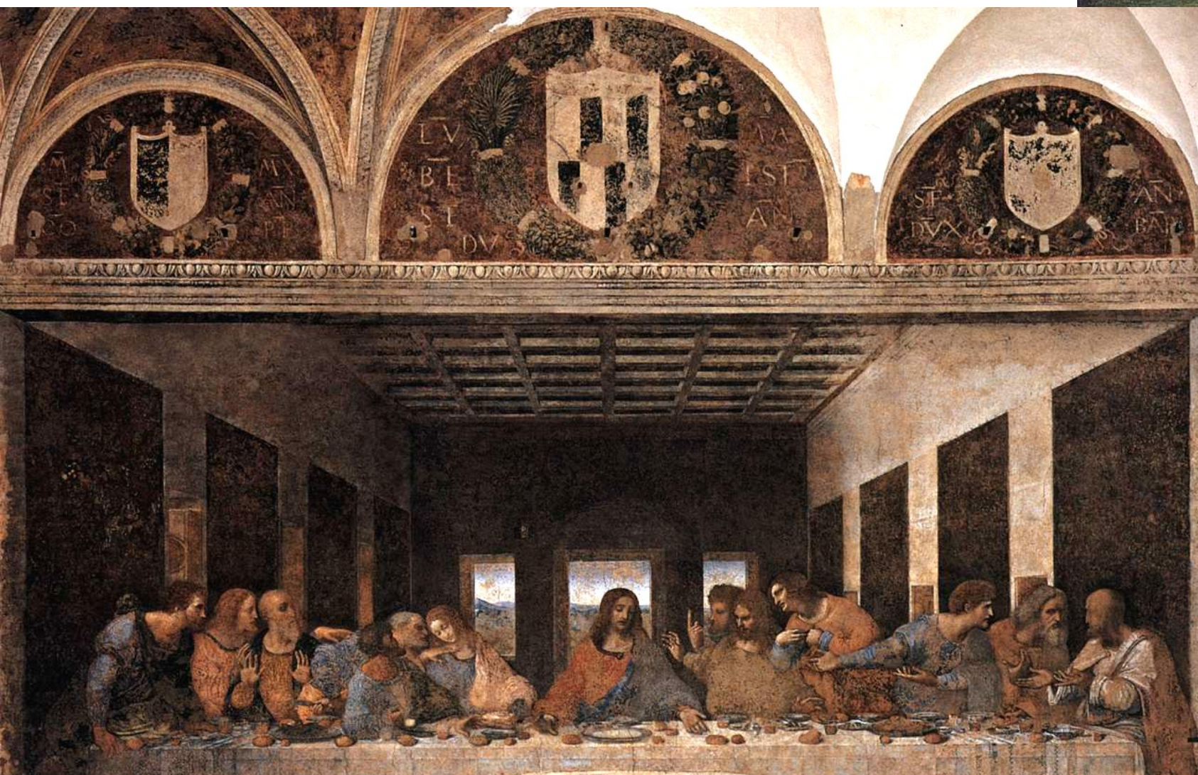
Poslední večeře, Milán