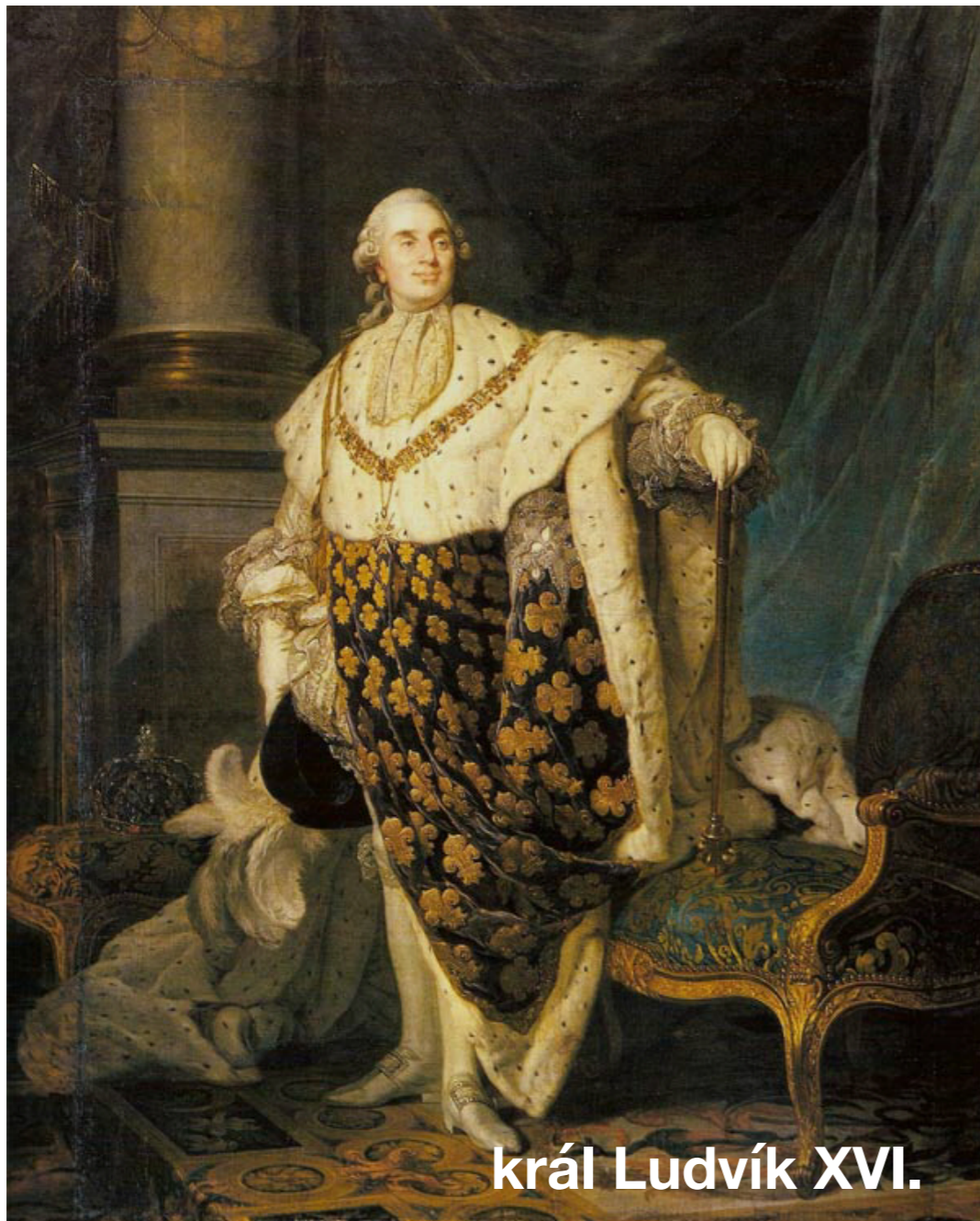
král Ludvík XVI.