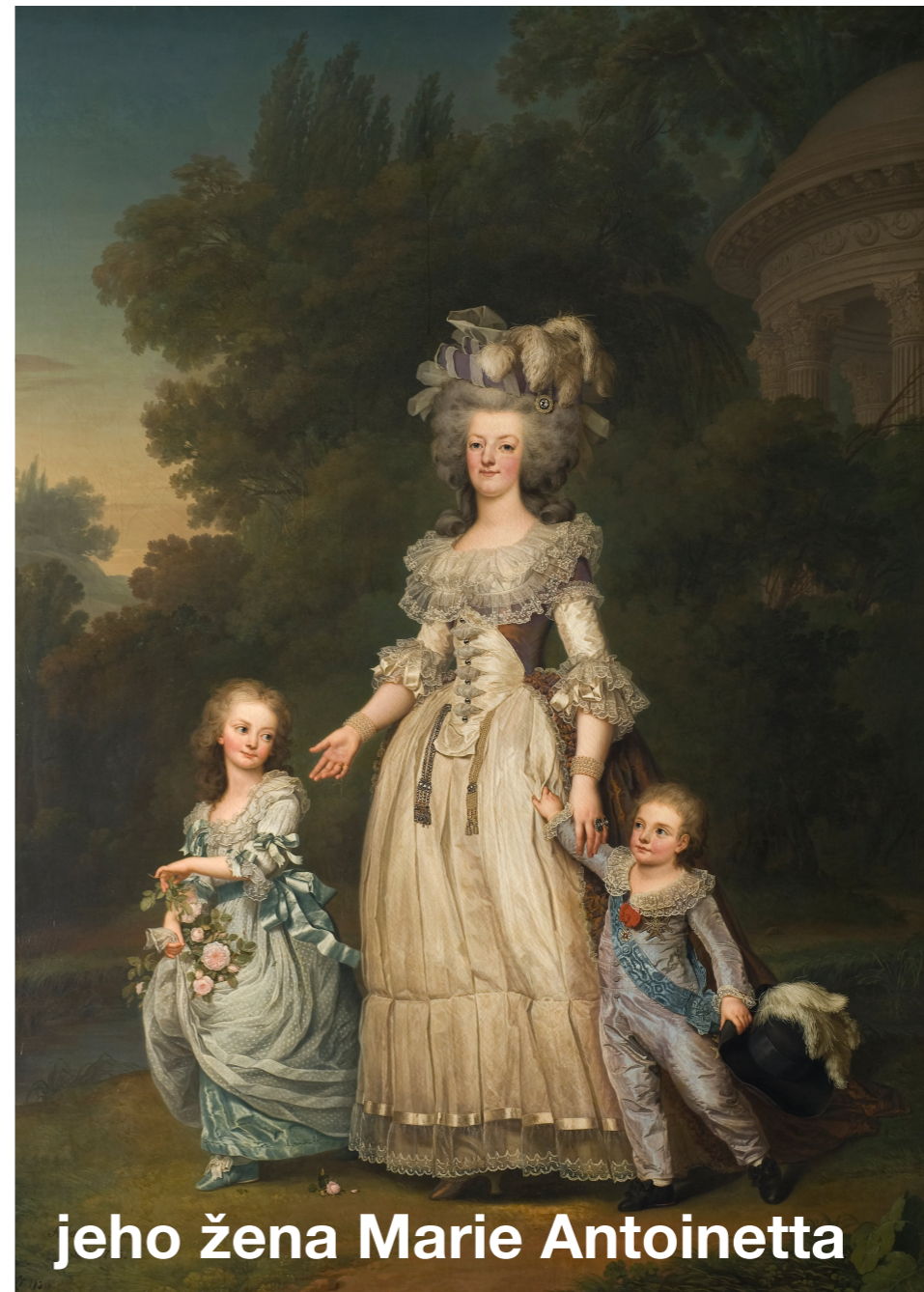
jeho žena Marie Antoinetta