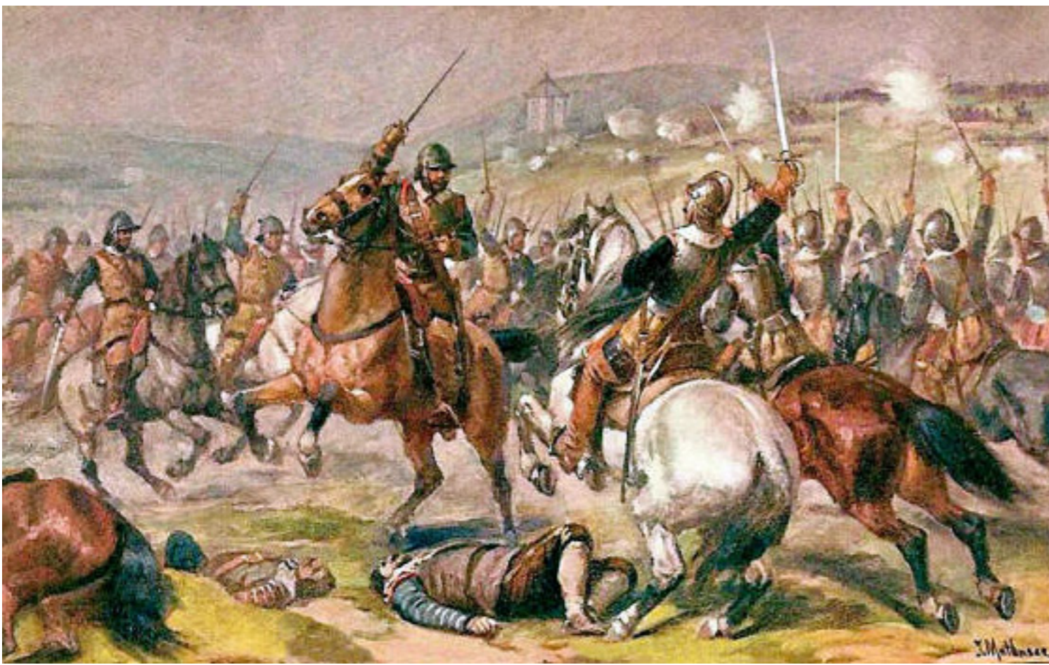
Bílá hora , dnes součást Prahy v pozadí letohrádek Hvězda