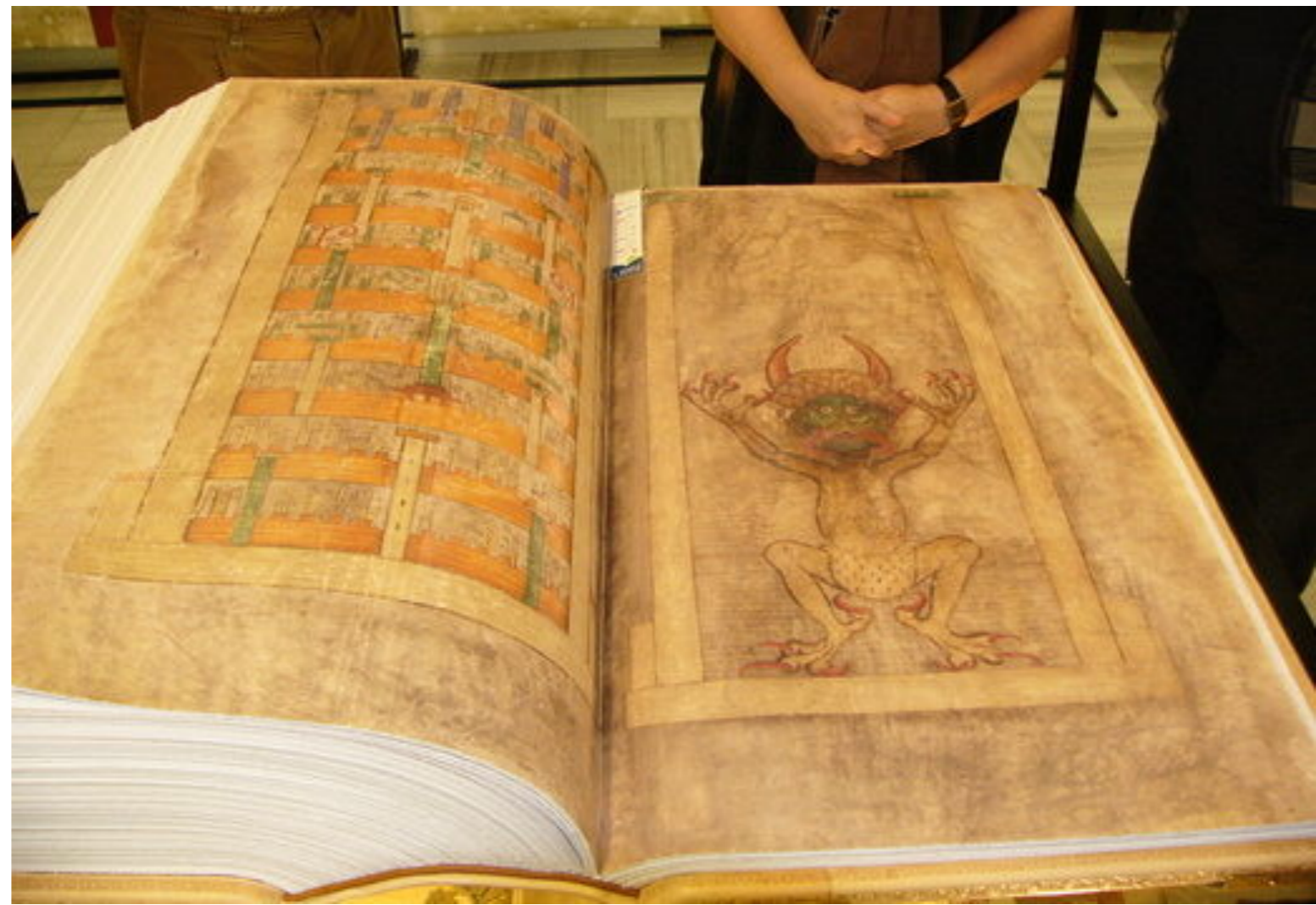
Codex gigas , “Dáblova bible” - největší rukopisná kniha na světě vznikla počátkem 13. stol. na našem území