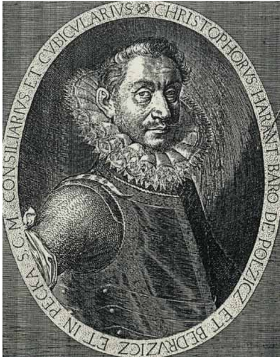
Kryštof Harant z Polžic a Bezdrůžic - cestovatel, spisovatel, hudební skladatel