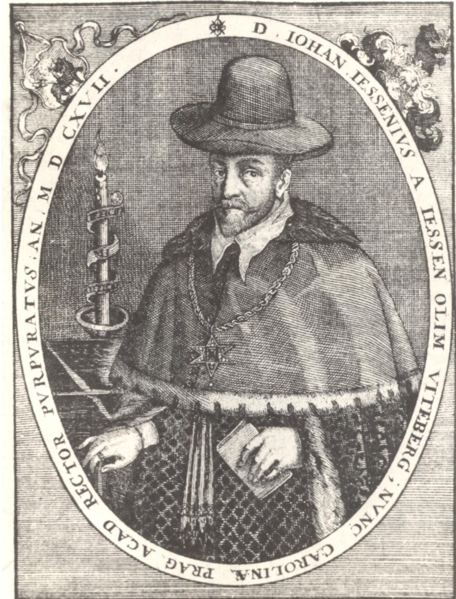
Jan Jesenius - lékař, filosof provedl první veřejnou pitvu v českých zemích